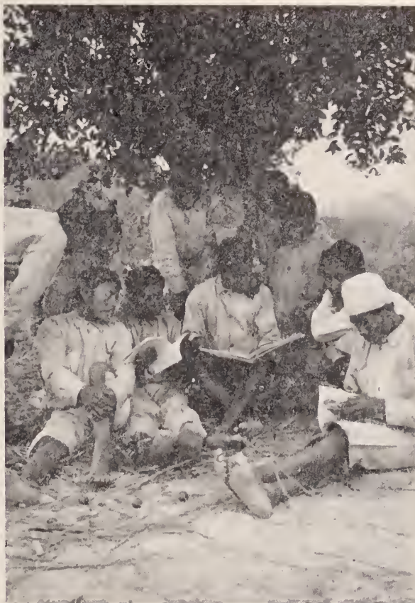
Los muchachos de la Misión entretenidos en la lectura de revistas que les han llegado de Caracas.